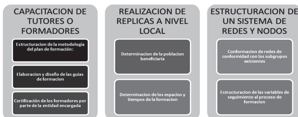
Gráfica 3: Estructura general del proceso FDF.

La metodología FDF se presenta como óptima. Este esquema se enmarca dentro de tres fases a saber: a. capacitación de tutores o formadores; b. Realización de réplicas en diferentes sectores; c. Estructuración de un sistema de redes y nodos.